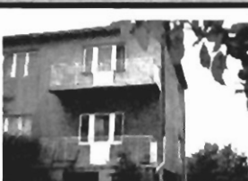
Zabawa 3 poziomowy, 6 pokoi, telefon, 13 a cena 800 mln zł