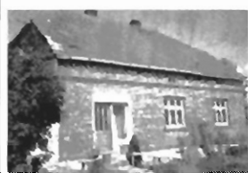
Czutów pow. 108 m 2 , parterowy, działka 50 a, pięknie położony, cena 300 mln zł