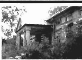
Dwór klasycystyczny 30 km od centrum Krakowa, 600 m 2 , do remontu, otoczony parkiem ze starym drzewostanem o pow. 1,5 ha, cena 1,6 mld zł