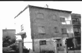
Wieliczka - os. Lekarka dom piętrowy, 3 kondygnacje, pow. 300 m 2 , 3 pok. na każdym poziomie, 2 kuchnie, 2 łazienki, tel. działka 4a, cena 1,8 mld zł