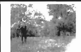
Włosz usytuowanie w malowniczym krajobrazie, sad, ogród i las o pow. 81 a w odległości 15 min. jazdy samoch. z Matecznego, dom (190 m 2 ) do wykończenia, cena 500 mln zł