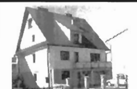
Myślenice pow. 400 m 2 , 8 pokoi, 4 łazienki, luksusowo wykończony cena 115.000 $