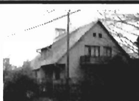
Zielonki 120 m 2 , 4 pokoje, 5 minut od centrum Krakowa, cena 72.000 $