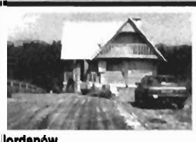
Jordanów dom całoroczny, pow. 120 m 2 , 3 kondygnacje, 5 pokoi, kuchnia, łazienka, podpiwniczenie, ogrz. akumulacyjne, stylowe umeblowanie kuchni, jadalni, działka 14 a, cena 1 mld

AGENCJA "TEMPUS POSZUKUJE TANICH DOMÓW W OKOLICACH KRAKOWA