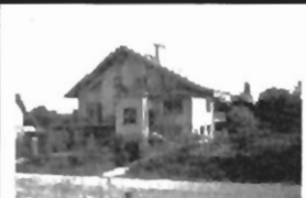
Nowy Wiśnicz nowy, pow. 480 m 2 , luksusowo wykończony, działka 38 a, widokowa cena 100.000 $