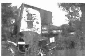
Głogoczów dom całoroczny, wykończony, działka 40 a, cena 1 mld zł