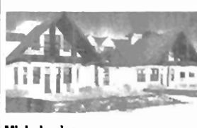
Michałowice Rezydencja (w budowie) o charakterze dworku (bliźniak) pow. 430 m 2 , tereny Parku Jurajskiego, działka 32 a, cena 620 mln zł całość lub 310 mln za segment