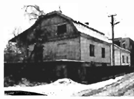
ok. Rydla - do remontu, 2 garaże, 2 tarasy, 300m2, 4,5a, Cena 180 tys. zł. K-241