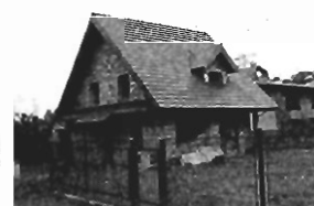
Swoszowice : 150 m2, 6 ar, stan surowy otwarty, cena: 105 tys. zł P-253