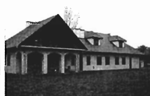
Zabierzów - 18a, pow. 700 m2, do wykończ., cena 150 tys. USD Z-237