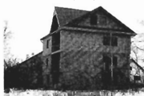
Jugowice - stan surowy zamkn., 350 m2, 5a, Cena 135 tys. zł. P-190