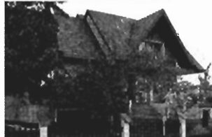
Bielany - 430m2, 5a w całości podpiwniczony, cena 100 tys. USD K-47