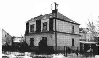
Prądnik Biały - 210 m2 dz. 5 a, cena 195 tys. zł. K-243