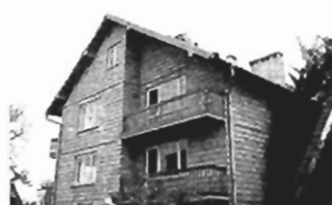
Kryspinów - pow. 150 m2, 3a, do wykończenia cena 120 tys. zł Z-264