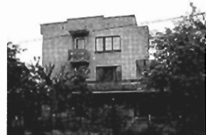
Jugowice : 190 m2, 8 ar, cena 189 tys. zł P-248