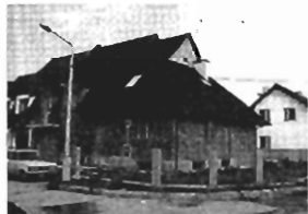
Witkowice - 300 m2, 5 ar, st. surowy otwarty, cena 180 tys. zł K-252