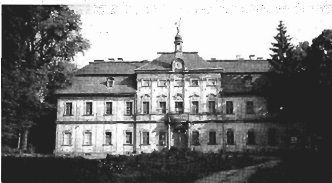
Duży wybór w okolicach Krakowa i na terenie całego kraju