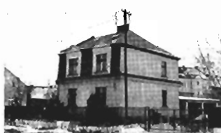
Prądnik Biały - 210 m2 dz. 5 a, cena 195 tys. zł. K-243