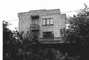
Jugowice : 190 m2, 8 ar, cena 189 tys. zł P-248