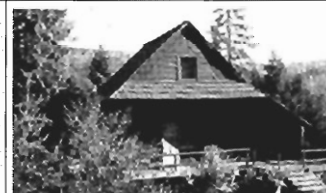
Lubomierz - całoroczny działka 10 ar, 100m2, cena 40 tys. USD, Z-219