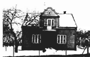
Swoszowice - 105 m2, dz. 9 a, garaż, cena 100.000 zł. P-170