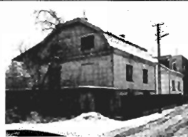
ok. Rydla - do remontu, 2 garaże, 2 tarasy, 300m2, 4,5a, Cena 180 tys. zł. K-241