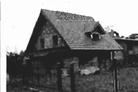
Swoszowice : 150 m2, 6 ar, stan surowy otwarty, cena: 105 tys. zł P-253