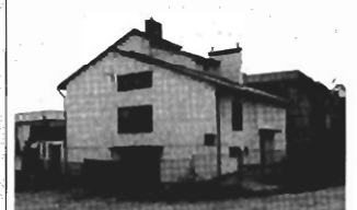
Jugowice - 240m2, 4a, całkowicie wykończony, cena 220 tys. zł P-69