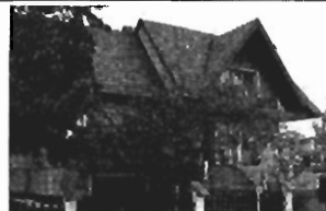
Bielany - 430m2, 5a w całości podpiwniczony, cena 100 tys. USD K-47