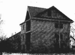
Jugowice - stan surowy zamkn., 350 m2, 5a. Cena 135 tys. zł. P-190