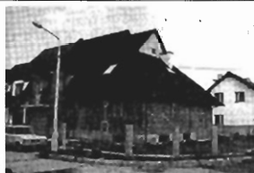
Witkowice - 300 m2, 5 ar, st. surowy otwarty, cena 180 tys. zł K-252