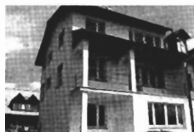
Kliny - nowy, 200 m2, dz. 5 a, 1/2 bliźniaka, cena 200.000 zł. P-53