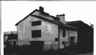
Jugowice - 240m 2 , 4a, całkowicie wykończony, cena 220 tys. zł P-69

os. Bieńczyce 100 m 2 , drewniany, działka 11 a, cena 50 tys. zł. NH-183