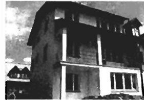
Kliny - nowy, 200 m 2 , dz. 5 a, 1/2 bliźniaka, cena 200.000 zł. P-53