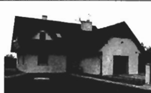
Swoszowice , 250 m 2 , dz. 6.5 ar, całkowicie wykończony (nowy), pięknie położony. Cena - 285.000 zł. P-228