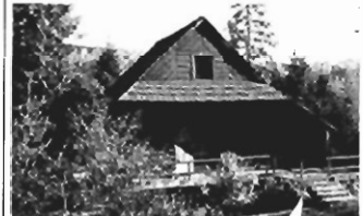
Lubomierz - całoroczny działka 10 ar; 100m 2 , cena 40 tys. USD. Z-219