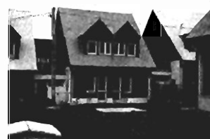
Kliny - 160m 2 , dz. 4ar, cena: 160.000 zł. P-221