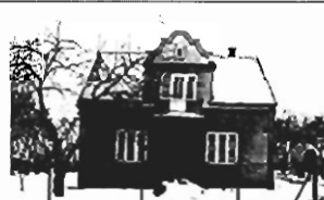
Swoszowice - 105 m 2 , dz. 9 a, garaż, cena 100.000 zł. P-170