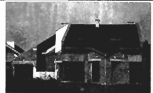
Zielonki - dz. 27 a, 270 m 2 , stan surowy zamknięty, raty! Cena 169.000 zł. P-222