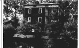
Tęczynek k. Krzeszowic - 162a, 250m 2 , stawy rybne, cena 250 tys. zł Z-236