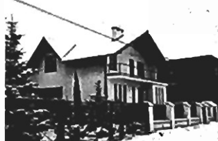
Bronowice - 220 m 2 +80 m 2 (garaż), dz. 8 a, cena 130.000 USD. K-175