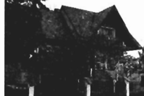
Bielany - 430m 2 , 5a w całości podpiwniczony, cena 100 tys. USD K-47