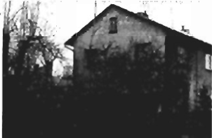
Biezanów - 120 m 2 , 1/2 bliźniaka, cena 125.000 zł., ładne wykończenie. P-217