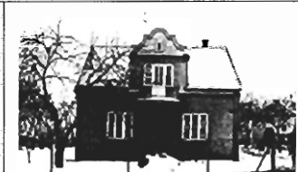
Swoszowice - 105 m 2 , dz. 9 a, garaż, cena 100.000 zł, P-170