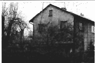
Bieżanów - 120 m 2 , 1/2 bliźniaka, cena 125.000 zł., ładne wykończenie. P-217