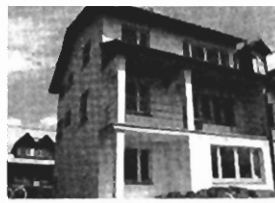
Kliny - nowy, 200 m 2 , dz. 5 a, 1/2 bliźniaka, cena 200.000 zł, P-53