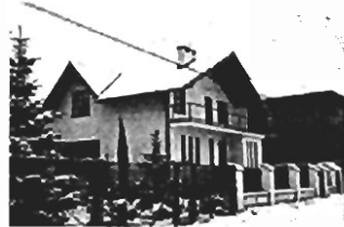
Bronowice - 220 m 2 +80 m 2 (garaż), dz. 8 a, cena 130.000 USD, K-175