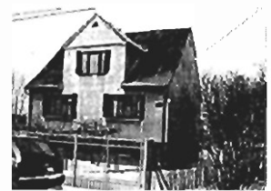
Sidzina - działka 28 a, 140 m 2 , cena 95.000 zł, P-192