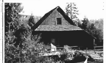
Lubomierz - całoroczny działka 10 ar; 100m 2 , cena 40 tys. USD, Z-219