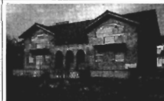
Wola Justowska - 400 m 2 , do wyk., 7,6 a, cena 110.000 USD K-216