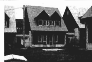
Kliny - 160m 2 , dz. 4ar, cena: 160.000 zł, P-221