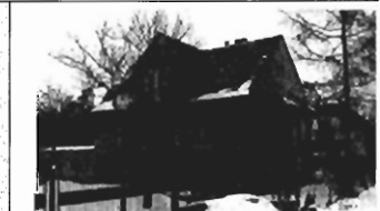
Jugowice - 130 m 2 , garaż, dz. 6 a, cena 150.000 zł, P-193