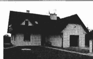
Swoszowice , 250 m 2 , dz. 6,5 ar, całkowicie wykończony (nowy), pięknie położony. Cena - 285.000 zł, P-228