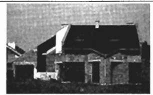
Zielonki - dz. 27 a, 270 m 2 , stan surowy zamknięty, raty! Cena 169.000 zł, P-222