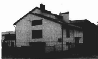
Jugowice , 240 m 2 , działka 4 a, - cena 200.000 zł