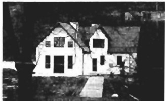
Wola Justowska , 250 m 2 , dz. 16 a, stan surowy zamk. - 260.000 zł