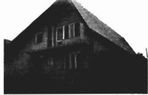
Ruczaj Zaborze , 200 m 2 , działka 4 a, wykończony, cena 180.000 zł