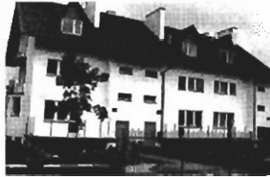
Borek Fałęcki , trzy segmenty w za- budowie szeregowej 3 x 240 m 2