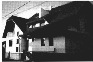
Swoszowice - dz. 11 a, pow. 250 m 2 , cena 85 tys. USD