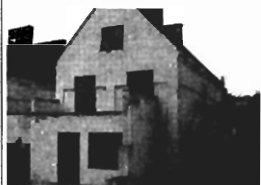
Zarzecze , 250 m 2 , dz. 7 a - 280.000 zł

ok. ul. Długiej kamienica 400 m 2 , 7 mieszk. + 130 m 2 wol- ne, lokal handlowy, działka 2,75 a, cena 230 tys. zł