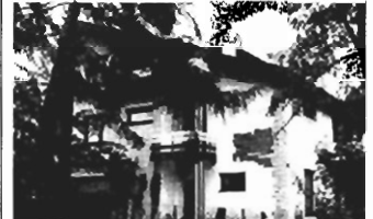
Jugowice , 350 m 2 , dz. 5,5 a, b. wy- soki standard - 105.000 USD