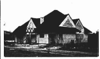
Prądnik Biały - 300 m 2 , 7,5 a, cena 110.000 zł