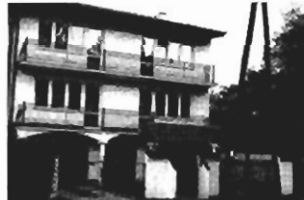
Krowodrza - pow. 350 m 2 , 1/2 bliźniaka, cena równ. 180.000 USD