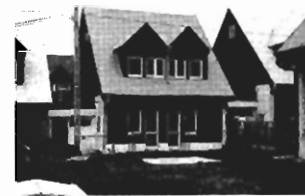
Kliny , 180 m 2 , superkomfort, dz. 3 a, - 210 tys. zł