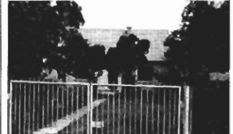
Wola Duchacka , 110 m 2 , dz. 4 a, 4 pok., cena 65.000 zł