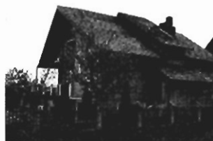
Bielany , 430 m 2 , działka 7 a, - cena 115.000 USD