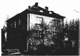
Olsza - 400 m 2 , 9 a, cena 180.000 zł, 3/4 udziału